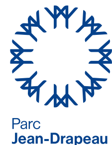
Version symbole prédominant